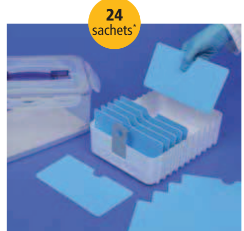
Réf. 5058 - 6.5L, portoir à 12 intervalles réglables.