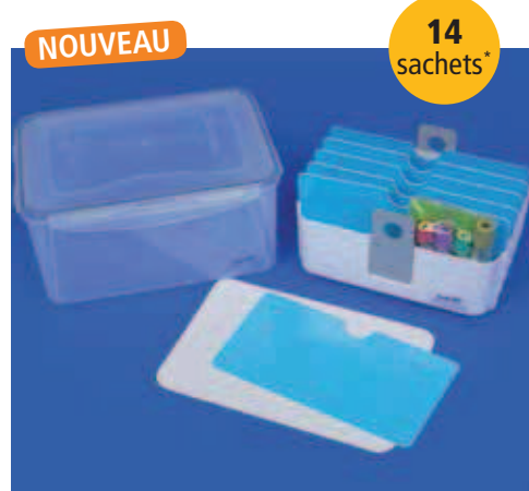
Réf. 5059 - 3.6L, portoir à 7 intervalles réglables.